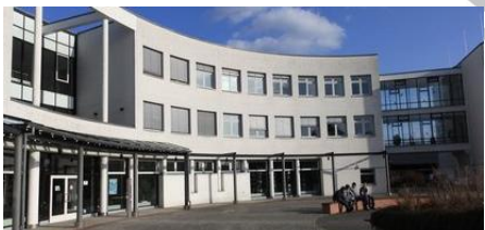
Институт, 1 050 кВт