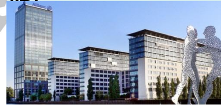
Комплекс административных зданий, 4 220 кВт