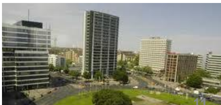
Университет, 900 кВт