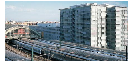
Железнодорожный вокзал, 1 250 кВт