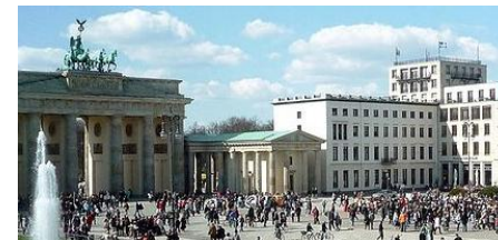
Банк, 2 400 кВт