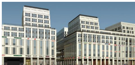
Универсальный магазин, 120 кВт

Информация предоставлена компанией GEA Refrigeration RUS OOO